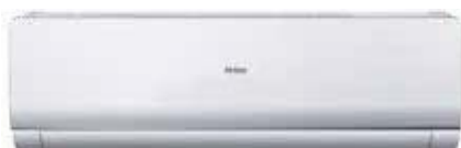
Кондиционер с панелью и корпусом белого цвета