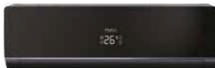
Кондиционер с панелью и корпусом черного цвета