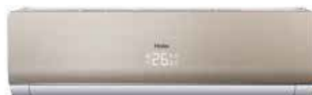
Кондиционер с панелью цвета ЗОЛОТО и корпусом серого цвета