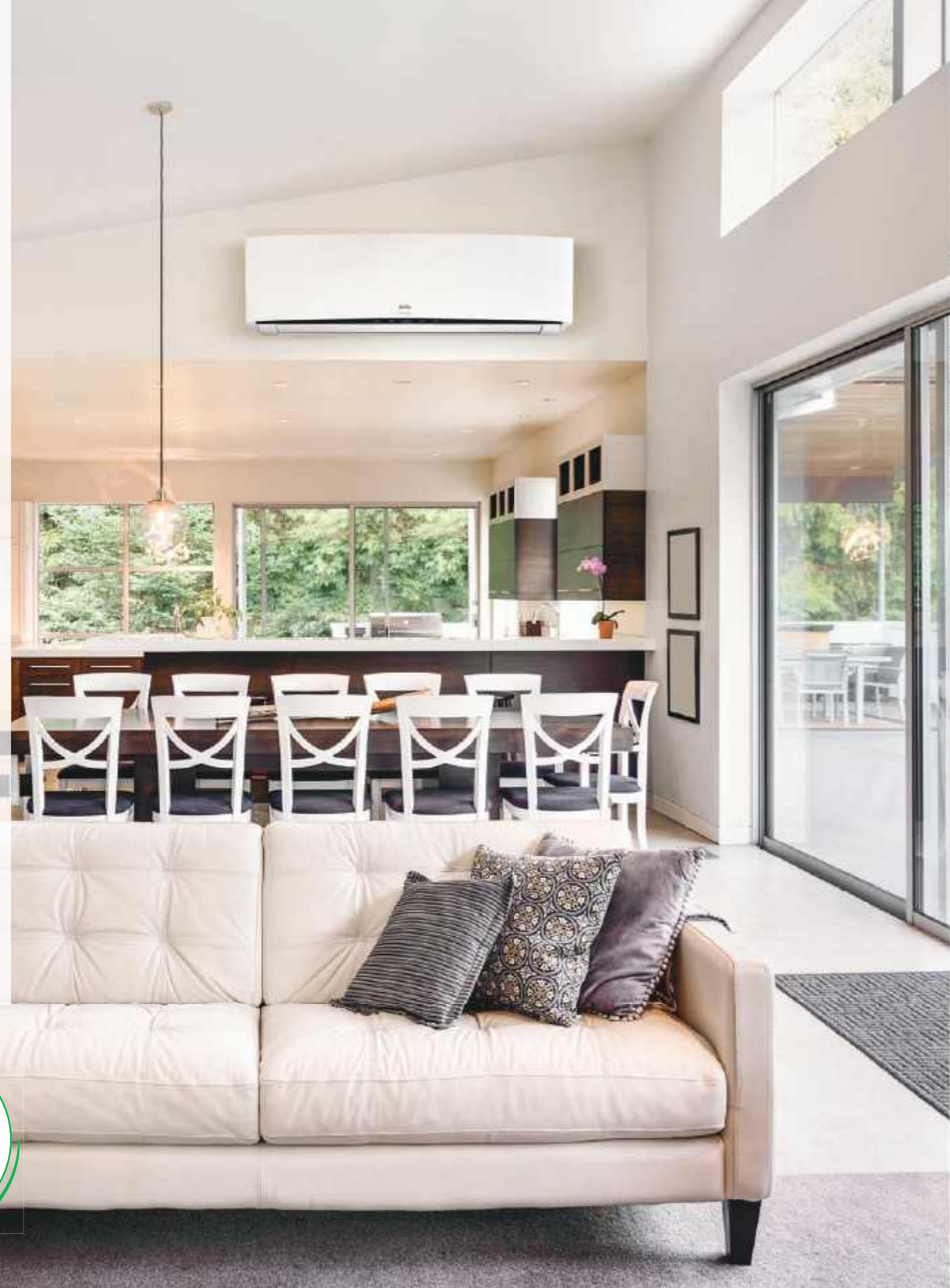
*На изображении представлена модель BSQ/in-36HN1_14Y

Контроль потока воздуха в 4 направлениях