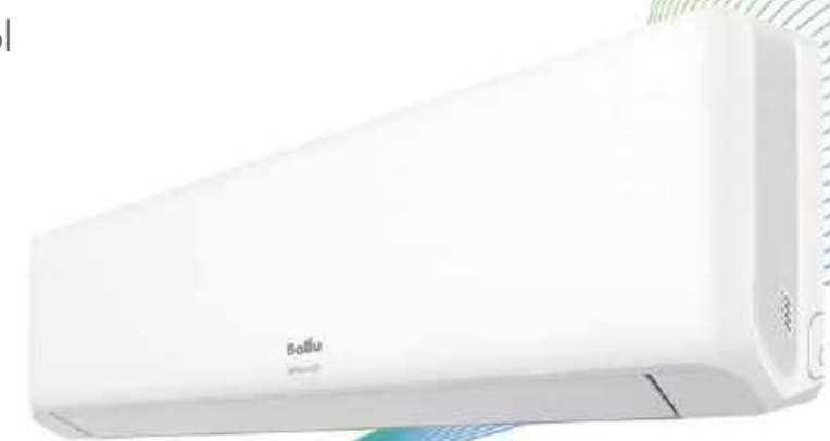
*На изображении представлена модель BSQ/in-36HN8

Bravo - высокопроизводительная модель с мощным воздушным потоком 1680 м 3 /час. Для удобства пользователя сплит-система оснащена опцией i-Feel и возможностью дистанционного управления положениями жалюзи в 4 направлениях. Высокая производительность позволяет использовать кондиционер в просторных жилых и коммерческих помещениях.